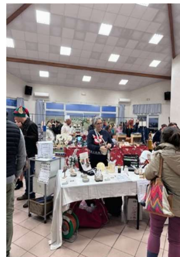
Nombreux exposants dans la salle polyvalente

Cette première édition nous laisse de beaux souvenirs et de solides bases pour les prochaines années.